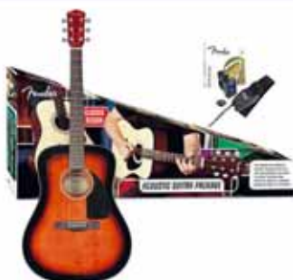
Fender CD-60 gítarpakki 26.990