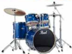
Pearl Export EXX trommusett með stöndum og málgjöllum 149.990