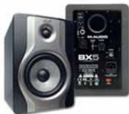
M-Audio Bx5 Carbon stúdíómónitorar 46.990